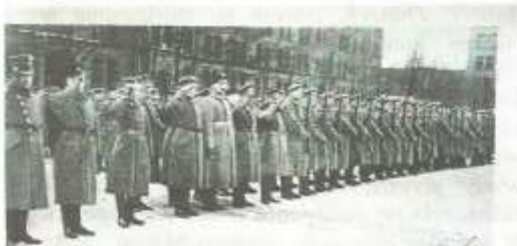
Zaprzysiężenie 1 Pułku Rezerw, późniejszego 10 Pułku Strzelców Wielkopolskich, a następnie 68 Pułku Piechoty na dziedzińcu koszar

11 listopada 1918 roku po latach zaborów powstało niepodległe państwo polskie. Polacy mieszkający w zaborze pruskim nie znaleźli się jednak w jego granicach. Zrzucenie jarzma zaborców w Polsce spowodowało, że Wielkopolanie rozpoczęli walkę o przyłączenie poznańskiego do Rzeczypospolitej. 3 grudnia 1918r. zwołano w Poznaniu Sejm Dzielnicowy, który powołał Naczelną Radę Ludową i jej reprezentanta Komisariat NRL. Instytucja ta była zwierzchnikiem Powiatowych Rad Ludowych. Zdemobilizowani z armii niemieckiej Polacy opanowali Rady Robotników i Żołnierzy. Powstały oddziały Służby Straży i Bezpieczeństwa.