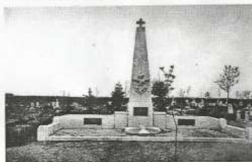
Września. Pomnik poległych w 1918/19 powstańców wielkopolskich na cmentarzu