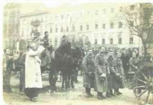
Msza św w Poznaniu przed wyruszeniem powstańców na front

Nie przyniosły rozstrzygnięcia walki pod Rawiczem. Od 16 stycznia 1919r. majora Taczaka jako głównodowodzącego zastąpił generał Józef Dowbor – Muśnicki. Na froncie północnym Niemcom udało się odzyskać Szubin. Na południu ciężkie walki toczono o Łaszczym, Szymanową, Zieloną Wieś, Miejską Górkę. Pod naciskiem marszałka Francji Ferdynanda Focha 16 lutego 1919r. podpisano w Trewirze rozejm, mocą którego alianci zmusili stronę niemiecką do przerwania działań na froncie wielkopolskim. Określił on linię demarkacyjną między walczącymi stronami. Podpisany w Wersalu 28 czerwca 1919r. traktat pokojowy przyznawał Polsce obszary, których powstańcy nie zdobyli m.in. Leszno, Kępno, Rawicz, Zbąszyń. Jeszcze po zawieszeniu broni Niemcy kontratakowali w rejonie Rynarzewa, Chodzieży, Kępna i Ostrzeszowa. Dnia 1 sierpnia 1919r. Sejm Ustawodawczy uchwalił włączenie ziem zaboru pruskiego do Polski. Traktat wersalski wszedł w życie 10 stycznia 1920r. i Polska przejęła wtedy przyznane jej ziemie. 28 marca 1920r. zakończyła się działalność frontu wielkopolskiego. W wyniku powstania wielkopolskiego, zwanego wtedy grudniowym, ziemie nad Wartą z miastami będącymi kolebką naszej państwowości wróciły po 125 latach do Polski. Jednak by ten powrót był możliwy życie musiało oddać 2 tysiące powstańców.